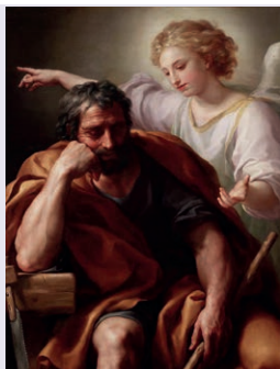
"Le rêve de Joseph"- Raphaël Mengs