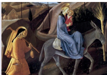
"Fuite en Égypte"- Fra Angelico