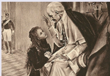
"Thérèse aux pieds de Léon XIII"- Céline Martin