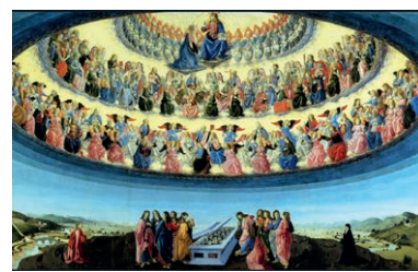
« L'assomption de la Vierge Marie », Francesco-Botticini - 1475

Ben ik dankbaar voor deze oproep tot heiligheid, tot liefde, die de Heer tot mij richt? Om hier beter op te kunnen antwoorden, (her)lees ik nrs. 14 tot 18 van de exhortatie «Gaudete et exultate» van paus Franciscus.