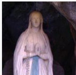
De Maagd Maria

”Ik beloof u niet u in deze wereld gelukkig te maken, maar in de andere”