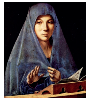
« La Vierge de l'Annonciation », Antonello de Messine

Met de Heilige Maagd Maria zijn ook wij, net als zij, vervuld van genaden, laten wij onze dankbaarheid uitspreken voor het verlossingswerk dat door Christus, onze Verlosser, is volbracht.