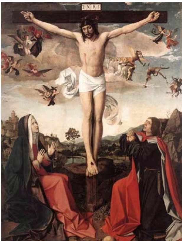
Le Calvaire, vers 1500