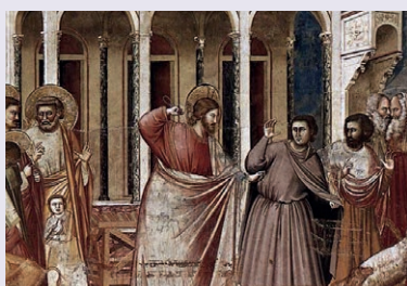
"Le Christ chassant les marchands du Temple"- Giotto di Bondone