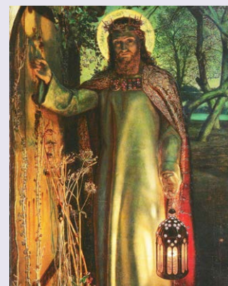
William Holman Hunt « Het licht van de wereld »

Wie zijn de mensen die het licht van Jezus voor mij laten schijnen?