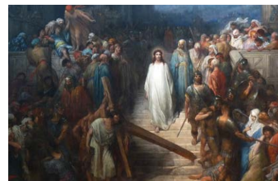
Gustave Doré « Christus verlaat het praetorium »

In hoeverre geloof ik dat God echt wil dat ik gelukkig ben?