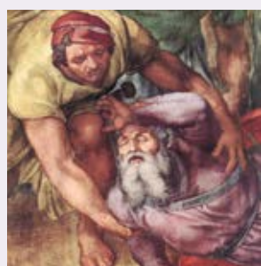
« De bekering van de heilige Paulus » Michelangelo