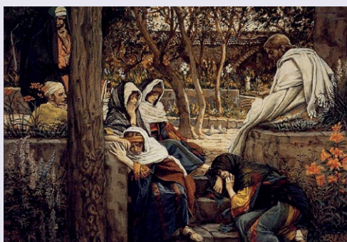
“Jésus à Bethanie, Marie, Madeleine et Marthe” - James Tissot