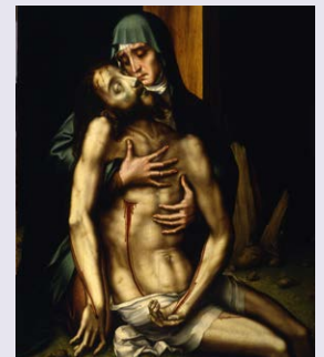
Luis de Morales - « Pieta »

Vandaag verricht ik een daad van liefde in vereniging met het lijden van Christus.