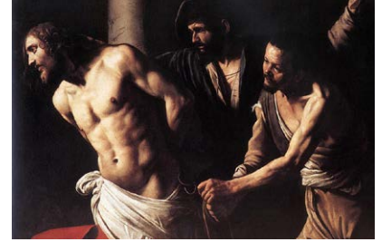
Caravage - « Geseling van Christus »

Ik beschouw Jezus die ervoor kiest zichzelf tot het einde toe te geven.