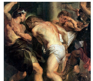
« Flagellation du Christ » Rubens

Jezus, jij die Degene kent die je gezonden heeft, ontsteek in ons een sterke liefde voor je Passie, onze ogen gericht op je Uur, om het werk van je Vader tot het einde te volbrengen!