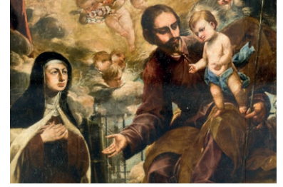
« Sainte Thérèse d'Avila et saint Joseph » Diego de la Cerda

« Een geliefde vader... Een vader in tederheid... Een vader in gehoorzaamheid... Een vader die aanvaardt... Een vader met creatieve moed... Een werkende vader... Een vader in de schaduw... O gezegende Jozef, toon u ook voor ons een vader. » (Paus Franciscus, Patris corde)