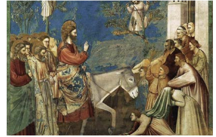
Giotto - « Toegang tot Jeruzalem »

Is de Heer Jezus mijn ware Meester, degene die mij in de diepte opvoedt?