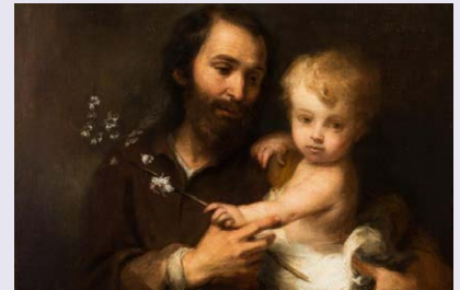
Bartolomé Esteban Murillo - « Sint-Jozef en het kindje Jezus »

Hoe beleef ik concreet mijn vertrouwen in de goddelijke Voorzienigheid, terwijl ik mijn verantwoordelijkheden nakom?