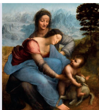
" La Vierge, l'Enfant Jésus et sainte Anne "- Léonard de Vinci