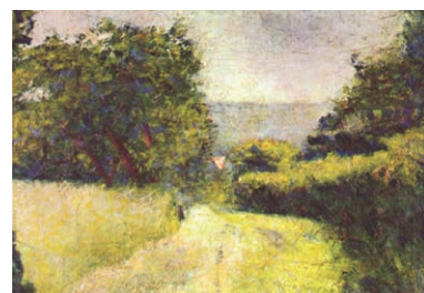
" Le Chemin creux "- Georges Seurat

Ben ik me bewust dat de wil van de Heer liefde is? Hoe beleef ik dit?