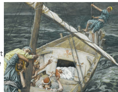
« Jésus dormant pendant la tempête » - James Tissot

Ik vraag de Heer om mijn geloof in zijn handelen in ons leven te vergroten.